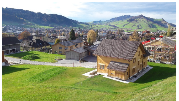
Blick ins Appenzellerland